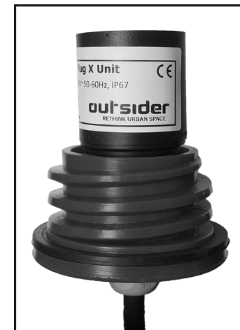
#900 L221/L222 Light Plug X Unit